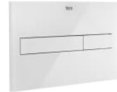
PL7 Dual - Placa de accionamiento con descarga dual