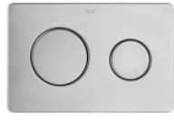
PL10 PRO - Placa de accionamiento antivandálica de acero inoxidable con descarga dual