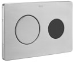
PL10-E PRO - Placa de accionamiento electrónica antivandálica de acero inoxidable con descarga dual automática o Touchless