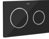
PL10 PRO - Placa de accionamiento antivandálica de acero inoxidable con descarga dual