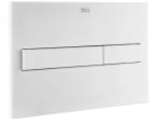
PL7 Dual - Placa de accionamiento con descarga dual