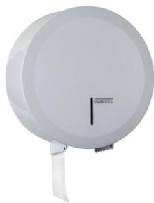
PR2783 Acabado blanco