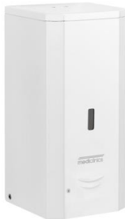
DJ0037A Acabado blanco