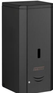
DJ0037AB Acabado negro mate