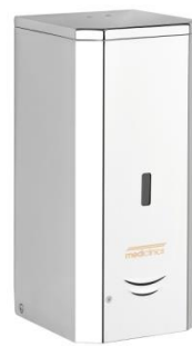
DJ0037AC acabado brillante