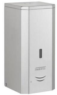
DJ0037ACS Acabado satinado