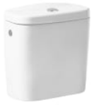
Cisterna de doble descarga 6/3L con alimentación inferior para inodoro