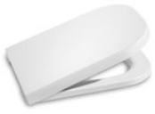
SQUARE - Tapa y asiento para inodoro con caída amortiguada